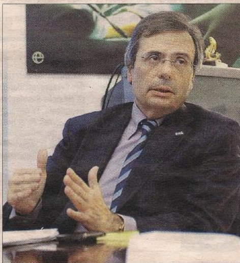
Rafael Matesanz, director general de la ONT.

Más datos: Europa registra por cuarto año consecutivo un ligero aumento (del 0,6 por ciento) en la tasa de donación. Los donantes regis-