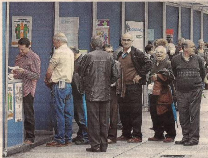
Muchos asistentes esperaban su turno para pedir información y realizarse diferentes pruebas.

Las diferentes asociaciones aprovechan esta cita para hacer visibles sus acciones pero, sobre todo, para informar a los ciuda-