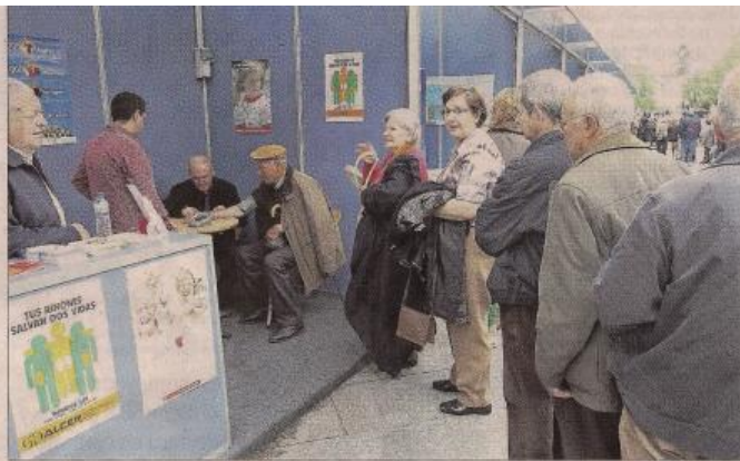
Colas para realizarse pruebas en la feria de la salud ubicada en Bispo Cesáreo.

ciosanitaria. Incluye talleres gratuitos de taichi de 11 a 13 horas y de danza saludable de 18 a 20 horas en la Alameda. Los interesados también disponen de un espacio en el que se realizan registros de colesterol, valoraciones antropométricas, controles de peso, talla e índice de masa corporal, además de asesoramiento nutricional y registros de CO 2 . También se realizan pruebas de tensión arterial, índice de glucosa, audiometrías, tensión ocular y talleres de memoria.