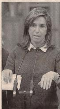
Ana Mato, ministra de Sanidad.

El Ministerio de Sanidad, Servicios Sociales e Igualdad da luz verde al incremento del precio de este tipo de medicamentos (distribuidos en catorce grupos terapéuticos distintos, desde sistema digestivo, hasta preparados hormonales, sistema nervioso o sistema cardiovascular) mediante una resolución de la Dirección General de la Cartera Básica de Servicios del Sistema Nacional de