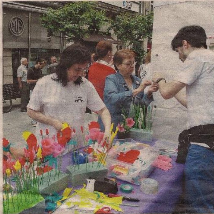
Alcer regaló ayer flores y camisetas para captar donantes.

En la provincia de Ourense tres personas donaron sus órganos a familiares en el 2007, otras