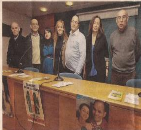
Miembros del Alcer y Aodem durante el acto de ayer. PILI PROL

sonas dializándose en hospitales de la provincia de Ourense y, según explican, «a diferencia de otras enfermedades, este tratamiento de la diálisis implica un duro golpe para estas personas, ya que sin éste sería imposible vivir, sino tiene la oportunidad de un trasplante». El papel de la trabajadora social será también muy importante para la puesta en marcha del proyecto ya que, según explican, son el primer acercamiento a la enfermedad y la puerta de entrada a la asociación. «solventando dudas acerca de la enfermedad mediante la atención social, visitas a domicilio y centro de diálisis, así como del asesoramiento y la gestión de recursos y ayudas», explicaron.