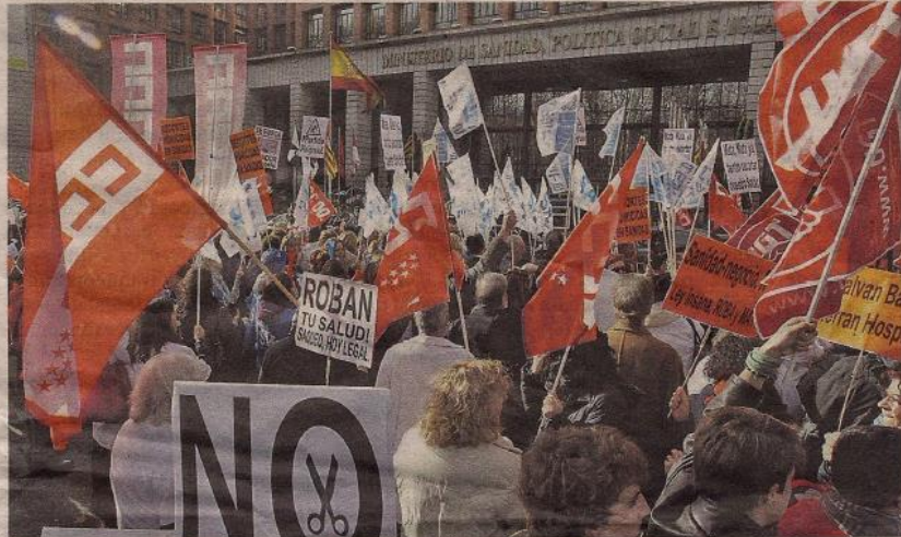
Los profesionales de la salud de Madrid llevan casi un mes de protestas por la privatización. KOTE RODRIGO

El ministerio también modificará en 2013 la división por renta para el copago farmacéutico por parte de los ciudadanos después de que se cumplan seis meses de la implantación de este nuevo gravamen que entró en vigor el 1 de julio. Ana Mato puso sus miras en aquellos ciudadanos que ganan entre 18.000 y 100.000 euros al año. A la ministra le parece un tramo demasiado grande de renta que habrá que dividir en más subgrupos. Sin embargo, advirtió de que no se modificarán los topes que abonan los pacientes. En la actualidad, esta modificación afectará a los pensionistas y a la mayor parte de los trabajadores. Los primeros, pagan el 10% de sus medicamentos con un límite de 18 euros al año cuando antes de la reforma no tenían que abonar nada. En cambio, la población activa abona hasta la mitad de los fármacos cuando antes no pasaba del 40 %.