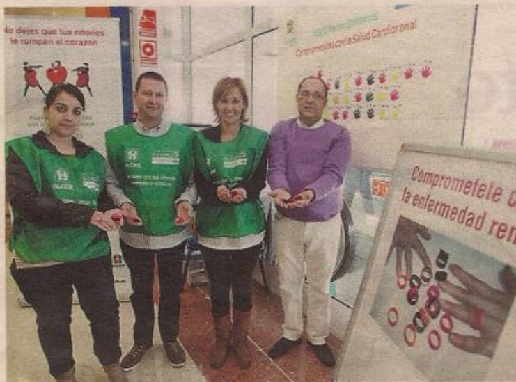
Voluntarios de Alcer Ourense ayer en Carrefour. PILI PROL