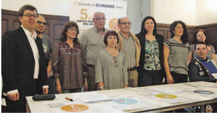
Representantes de los colectivos participantes en el acto inaugural del programa. MIGUEL VILLAR

La cita tiene este año como objetivo llamar la atención sobre la necesidad de extremar los controles sanitarios sobre los alimentos para evitar contaminaciones pero también la aparición de enfermedades transmitidas