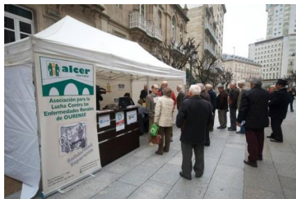
Os ourensáns fixeron cola para facer as probas preventivas.

Data de celebración: segundo xoves do mes de marzo, este ano o día 12.