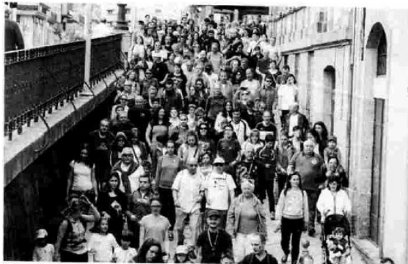
La andaina sen fume reunió a un nutrido grupo de ourensanos.

Los paseos fluviales, los puentes que cruzan el Miño y la Alameda fueron los puntos por lo que discurre la sexta edición de la "Andaina sen fume", una ruta que pretende dar importancia a la actividad física. Paralelamente, "Un camiño solidario" organizado por la asociación Alcer, recorrió las márgenes del Miño, una actividad que se llevó a cabo como la apertura de la Semana del Donante. ■