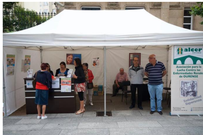
A carpa que instalamos na rúa do Paseo.

ALGER Ourense: Asociación sen ánimo de lucro, CIF: G-32.011.041, nº rexistro de entidades voluntarias O-44 nº rexistro provincial 277, declarada de utilidade pública data de constitución 29 de xaneiro do 1982 - Dirección: Rúa Recaredo Paz nº 1 – CIS AIXIÑA, 32.005 (OURENSE) Tlf: 988.229.615 / 663.780.330 - alcerourense@hotmail.com - www.alcerourense.com - Facebook: asociacion.alcer.ourense