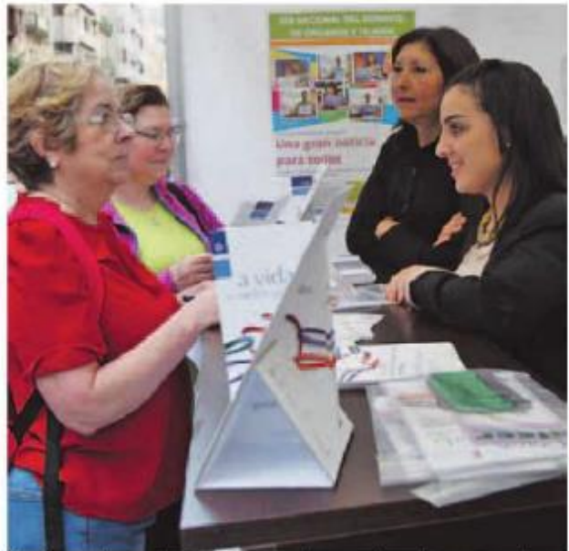
Muchos vecinos se interesaron por cómo ser donantes.