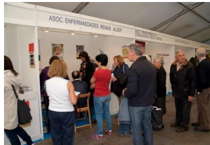
Cola para facer as probas.