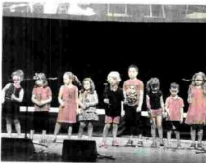
Una de las actuaciones de la gala.

cios y los familiares de éstos compartan experiencias y dialoguen sobre sus inquietudes comunes. Además, quieren darle especial importancia al programa de atención a pacientes en las salas de diálisis con los que las trabajadoras sociales realizan visitas a los pacientes de los diferentes turnos de diálisis dándoles apoyo psicosocial y atendiendo las consultas.