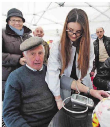
La Escuela de Enfermería ayudó en la jornada de Alcer. MIGUEL VILLA

La llamada de atención a los ourensanos, en forma de mini consulta en la calle, con mediciones de glucosa, tensión y peso gracias a la colaboración de la Escuela Universitaria de Enfermería, funcionó a las mil maravillas. Hubo incluso colas en algunos momentos del día. A mitad de la jornada ya habían pasado por ese pequeño chequeo cerca de un centenar de personas y algunos se fueron con la recomendación de mejorar sus hábitos alimenticios o de visitar a su médico de cabecera. «Detectamos bastantes casos de tensión alta», señalaba el equipo de enfermeros.