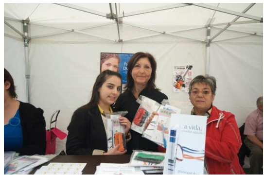
Voluntarias e traballadora social co pack informativo que se entregou.