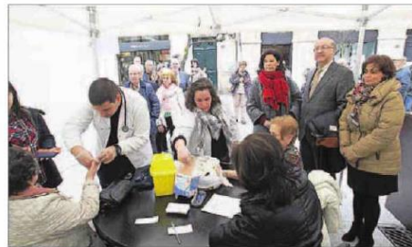
La carpa de Alcer, durante las pruebas a viandantes.