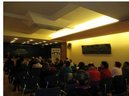
Os asistentes á charla moi atentos