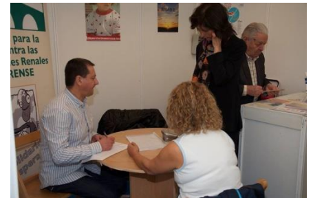
Una señora está realizando a proba da tensión arterial con voluntarios de Alcer.