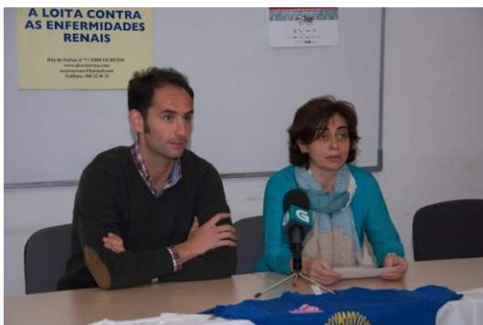
O presidente do COB e a presidenta de Alcer na roda de prensa

Podemos comprobar, que foron 22 persoas as que declararon ser diabéticas , e 20 as que tiñan hiperglucemia neses momentos, polo que o persoal de enfermería, recomendoulles, facer unha visita ao seu médico de cabeceira para saír de dúbidas .