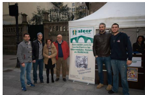
Os xogadores do COB foron facer unha visita á carpa de Alcer.