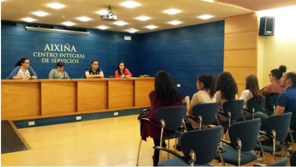
Charla do día 7 de maio.

a alumnos de primeiro e segundo curso do Ciclo Medio de Atención a Persoas en Situación de Dependencia do CIFP PORTOVELLO, en sendas visitas ó CIS Aixiña.