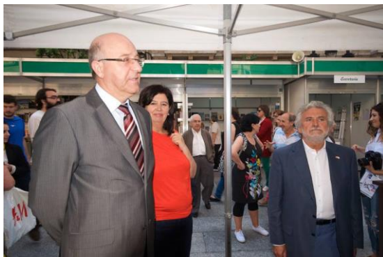
Autoridades na carpa.