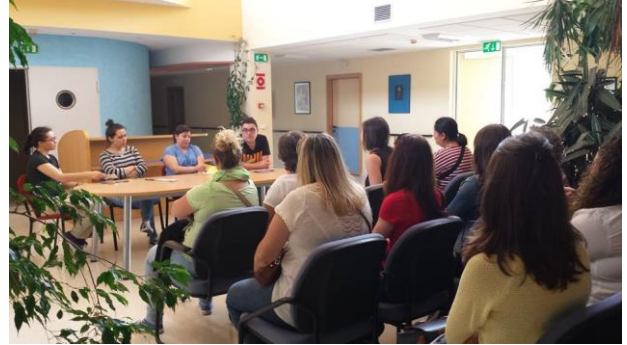
Charla do día 14 de maio.