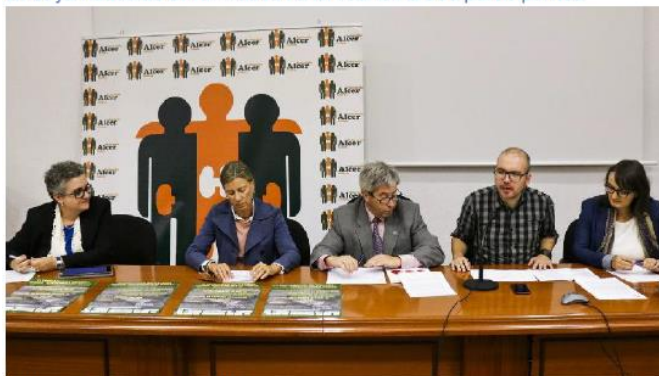
SaNTiaGO / LA VOZ 26/09/2017

Unas jornadas de enfermedad renal reúnen a 300 participantes