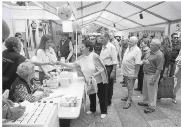
Cola en la caseta de la asociación diabética Auria para realizarse un control de glucosa