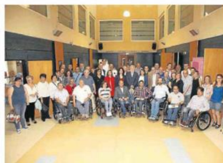
Los asistentes a la XXVII asamblea de Cogami, en el centro Aixaña.