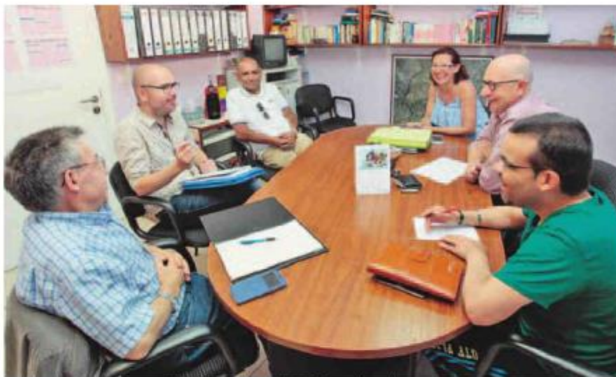
La directiva de Alcer se reunió con miembros de la federación gallega. CARLOS CASTRO