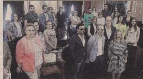
El alcalde, con representantes de colectivos participantes. ■ Faro de Vigo

de realizarse chequeos gratuitos, podrán descubrir cómo superar la depresión gracias a las mascotas, participar en un taller de risoterapia o escuchar a un cuentacuentos en lenguaje de signos. El alcalde tuvo un reconocimiento a la labor de todos los colectivos participantes.