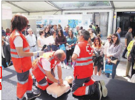
Actividades realizadas en la Feira da Saúde, en la avenida de Pontevedra.

de Enfermos Crónicos y Colitis Ulcerosas, Asociación Amigos de Investigación Tascos, Asociación de Personas con Discapacidad, Asociación de Salud Emocional en la Infancia y Adolescencia, Asociación Feas Galicia, Comité Ciudadano Artista,