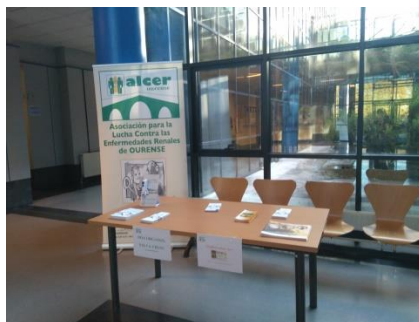
Mesa informativa no edificio politécnico