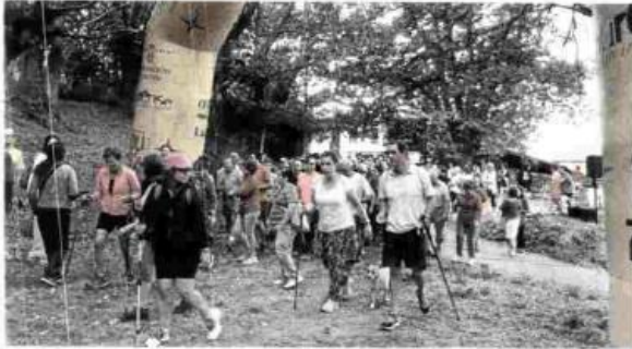
Salida de los caminantes en la andaina solidaria.