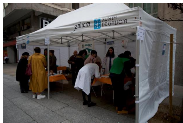
A carpa que a asociación instalou na rúa do Paseo de Ourense

ALCER Ourense: CIF: G-32.011.041, Data de constitución: 29 de xaneiro de 1982 Nº rexistro provincial 277, declarada de utilidade pública, nº rexistro de entidades voluntarias O-44 Enderezo: Rúa Recaredo Paz nº 1 – CIS Aixiña, 32005 Ourense Tfno: 988 229 615 / 663 780 330 alcerourense@hotmail.com – www.alcerourense.com – Facebook: asociacion.alcer.ourense – Twitter: @AlcerOurense