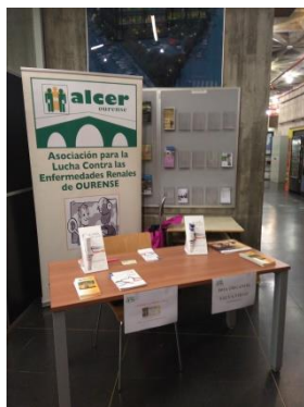
Mesa informativa no edificio facultades

Contouse con moito interese por parte dos estudantes e profesorado, entregando uns 250 folletos informativos e cubríndose en total 18 solicitudes de tarxeta de doador ó longo dos 3 días nos que a mesa estivo colocada.