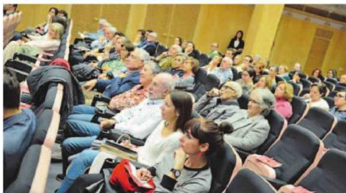
Al finalizar la charla el público pudo plantear al ponente aclaraciones a sus observaciones y preguntas.

de lo lógico» será posible asumir esa realidad que se avecina. Invitó a «derrubar muros entre todos» para cambiar la mentalidad y lograr una vejez menos dependiente y más activa. El gerente recordó que la salud no está en los hospitales «y el mejor hospital está en nuestra casa».