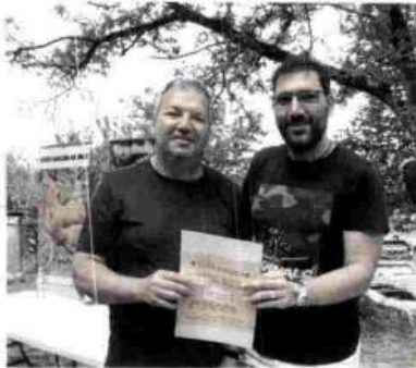
El presidente entrega uno de los regalos.