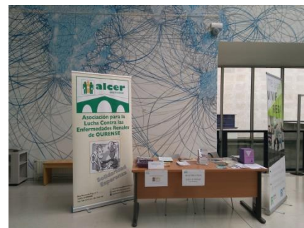
Mesa informativa no edificio ciencias empresariais, turismo e dereito