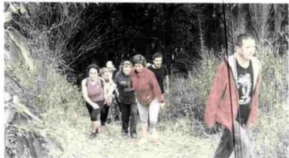
Algunos de los participantes durante el recorrido.