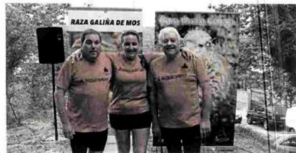
Los participantes de la actividad hicieron gala de su buen humor.