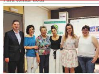
La iniciativa se presentó ayer en Ponte Vella. MIGUEL VILLAR