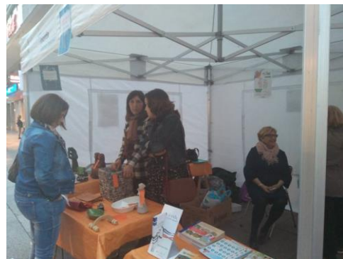
O mercadillo solidario de ALCER Ourense 2017