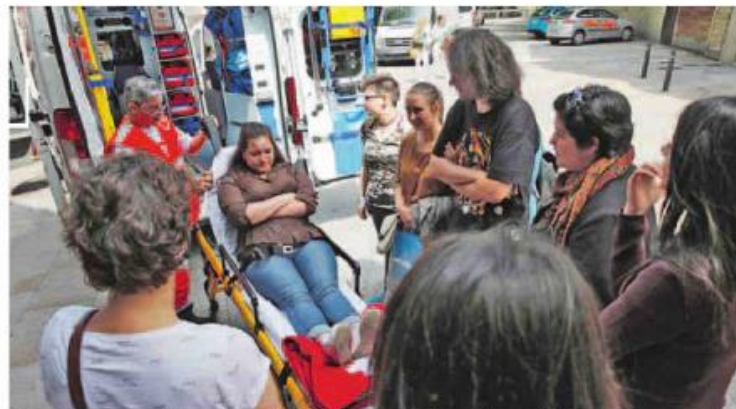
Además de la información en las casetas, la feria ofrece charlas y talleres prácticos.